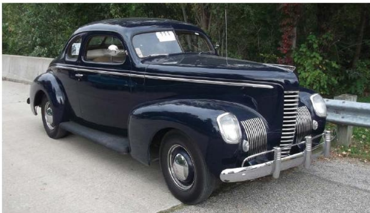
Nash Ambassador Eight Coupe, 1939 год