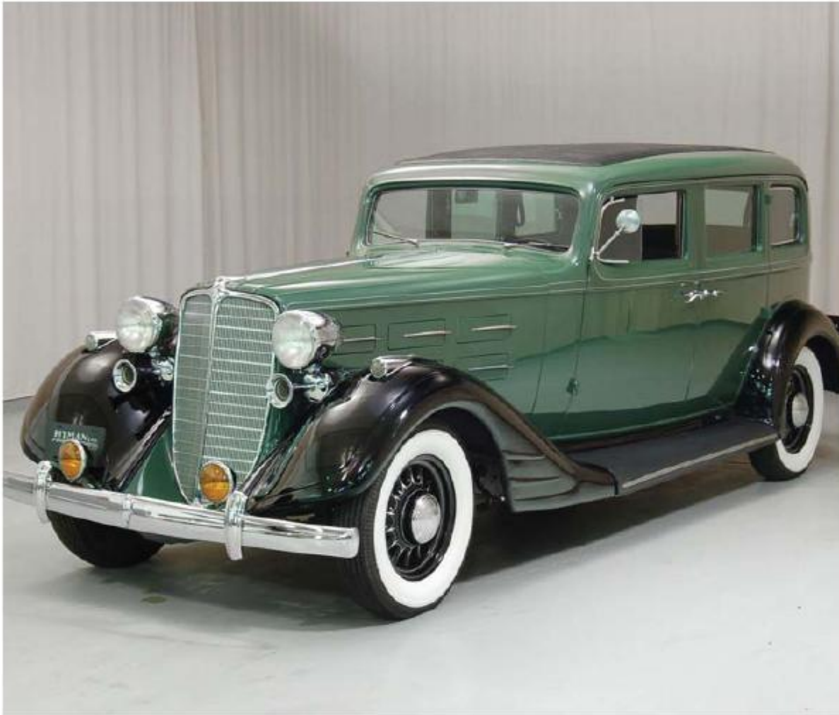
Istoriya \ Nash Sedan 1934 года