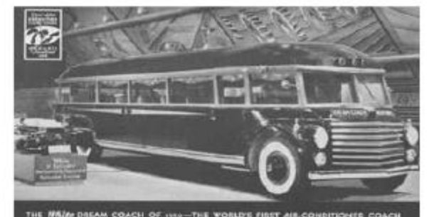
White Dream Coach 1950 года – первый в мире автобус с кондиционером – 1