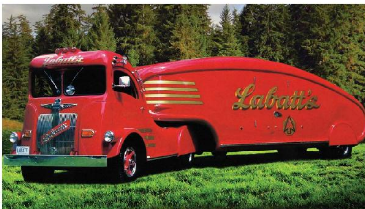
White WA122 Labatt's 1936 года