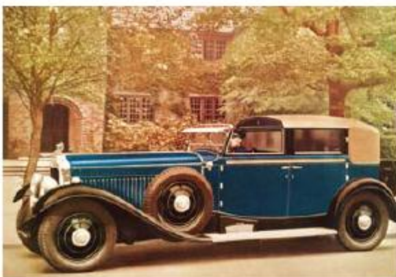
Minerva AH Van den Plas 1927 года