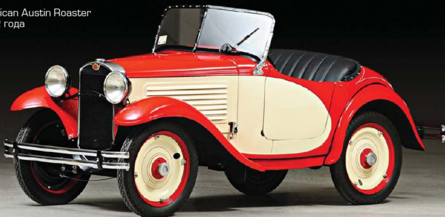
American Austin Roaster 1932 года