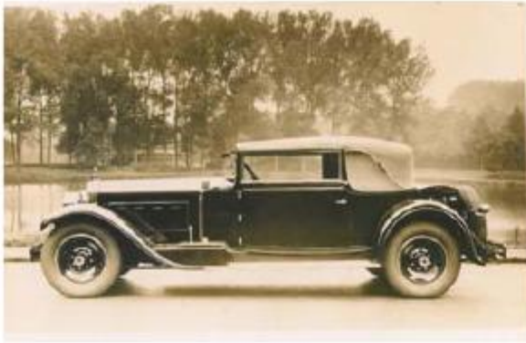
Packard Convertible Victoria Van den Plas 1928 года