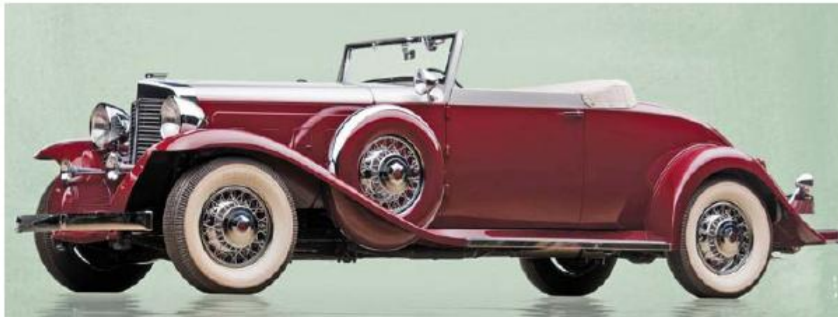
Marmon Sixteen Convertible Victoria 1931 года