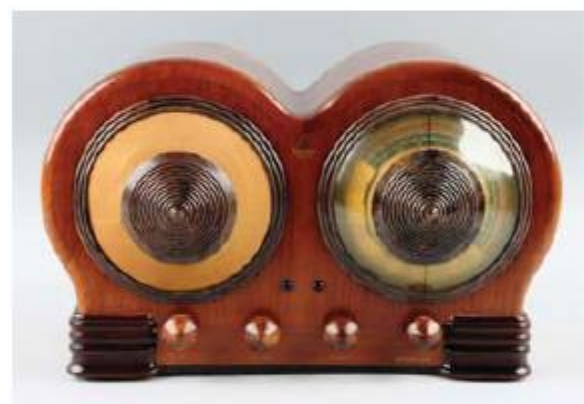
Радиоприемник Emerson Model BD-197