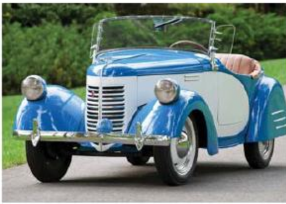
American Bantam Model 62 Deluxe Roadster 1939 года