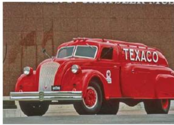
Dodge Airflow Tanker Truck, 1938 год