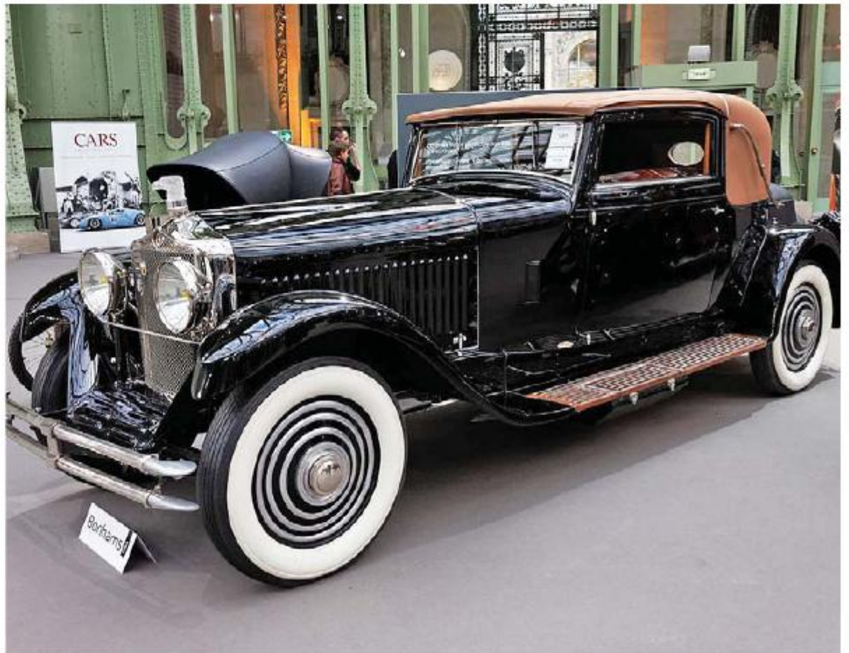
Minerva AK Faux Cabriolet 1929 года

он очень быстро продвинулся вверх по карьерной лестнице и стал арт-директором.