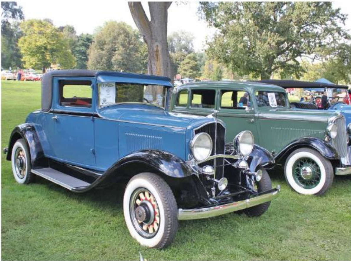
DeVaux Coupe 1931 года