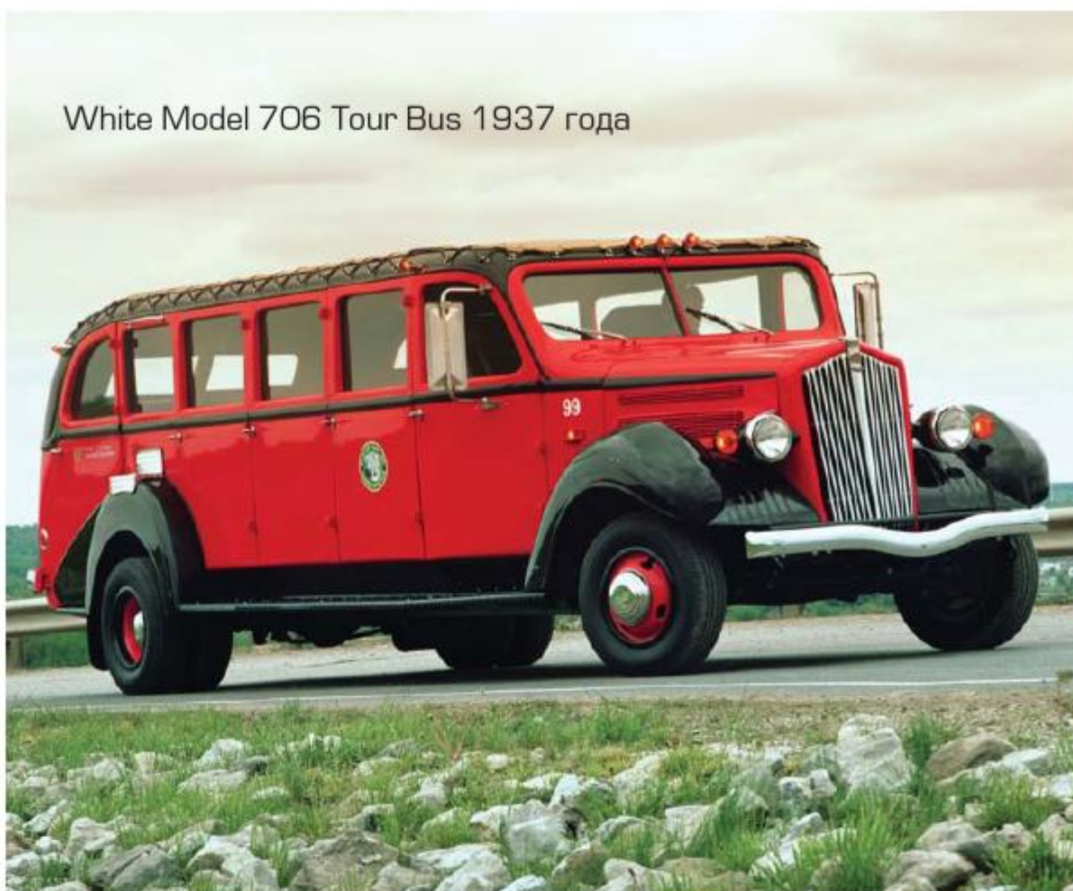
White Model 706 Tour Bus 1937 года