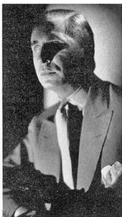
THE COUNT DE SAKINOFFSKY