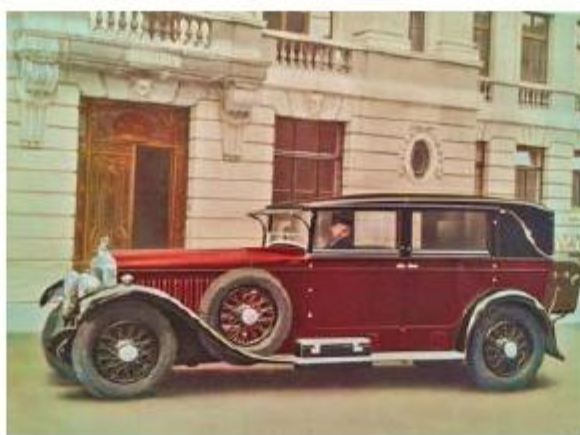
Minerva AH для индийского махараджи, 1928 год

В середине 30-х годов Сахновский заинтересовался аэродинамикой и начал внедрять редкий тогда обтекаемый стиль. Его проекты во многом опережали время. Первенцем стал кабриолет Auburn 851 SC Boattail Speedster с зауженной задней частью, как у лодки (см. "Тест-Драйв" за декабрь 2009 г.), в создании которого дизайнер принял участие. Автомобиль не только выглядел стремительно, но и мог развить 165 км/ч благодаря 150-сильной компрессорной "восьмерке".