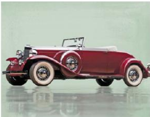
Marmon Sixteen Convertible Victoria 1931 года