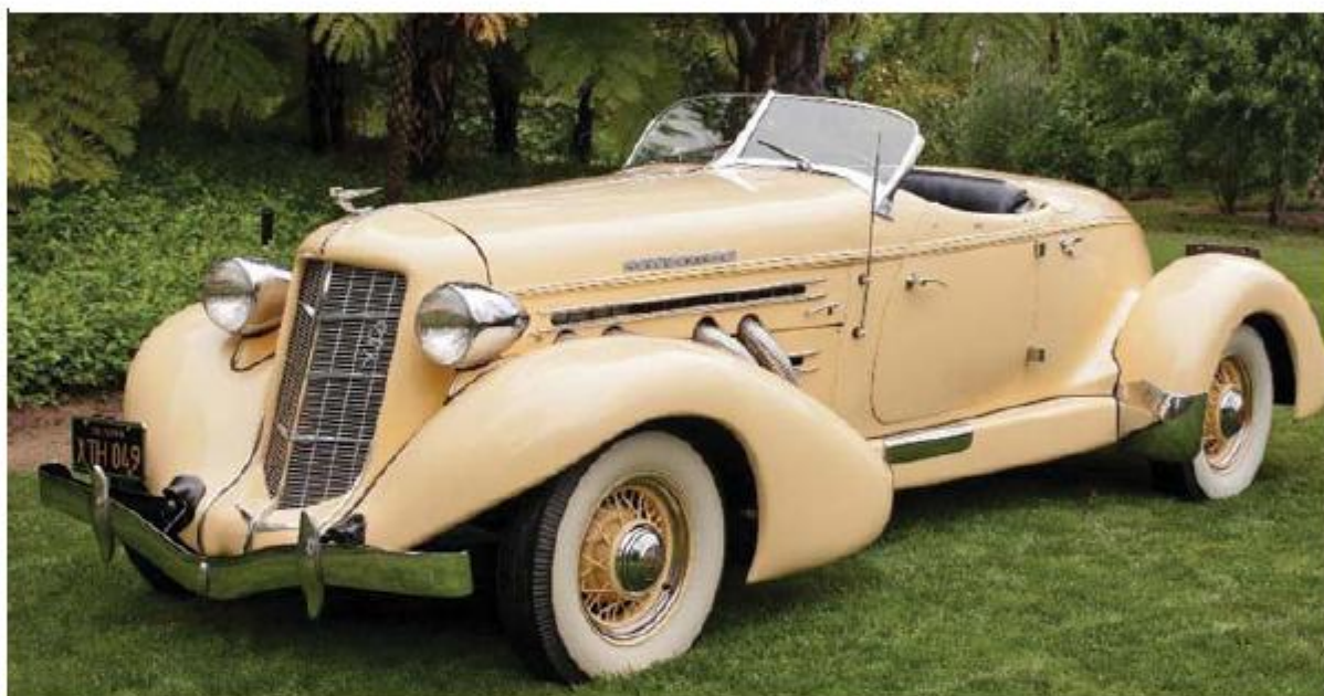
Auburn 851 SC Speedster 1935 года