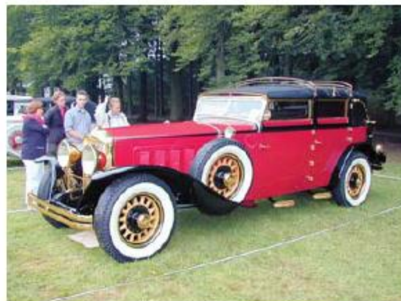
Minerva AL 40 CV Van den Plas 1929 года