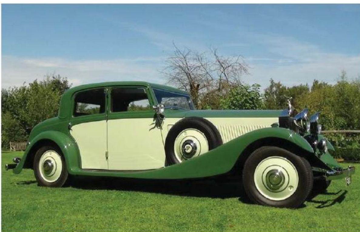
Rolls-Royce 20 HP Van den Plas Sedan для сына Артура Конан Дойля