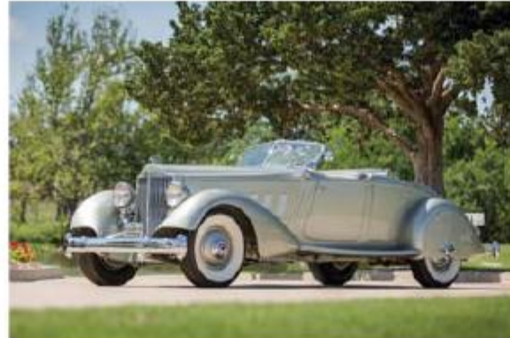
Packard Twelve Dual Cowl Sport Phaeton, 1934 год