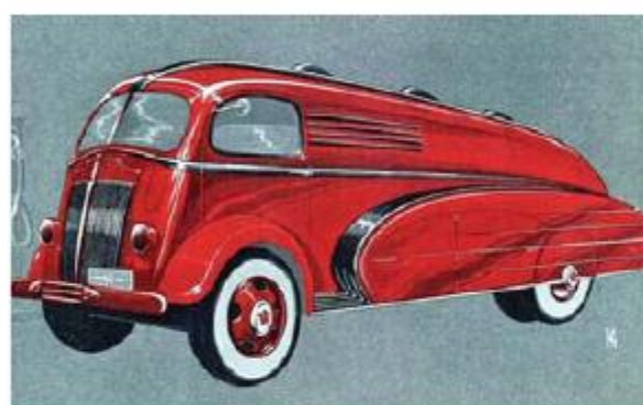
Проект обтекаемого бензовоза авторства Сахновского