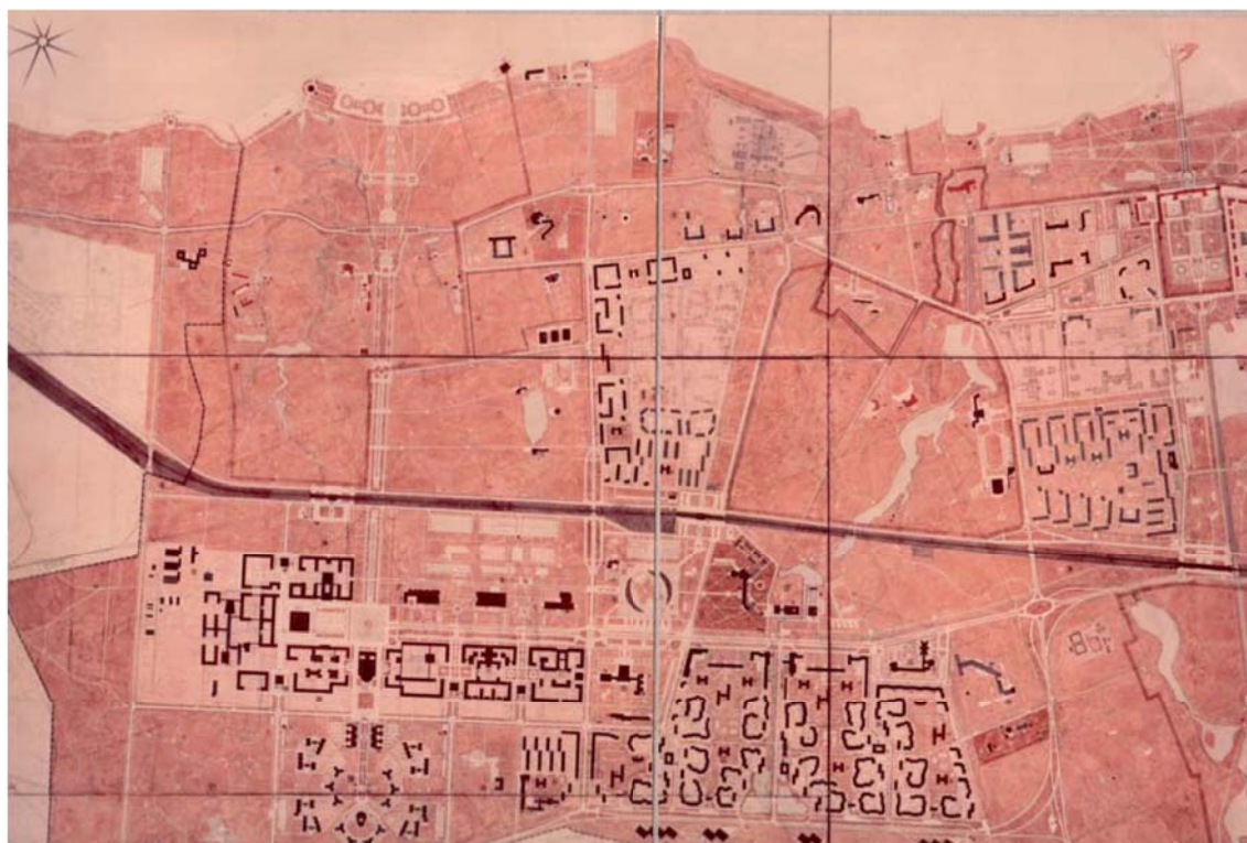
Рис. 1. Общий план проектируемого комплекса Ленинградского государственного университета им. А. А. Жданова в городе Петродворце. ЛенНИИпроект, 1968–69 гг.

• организация учебной и научной функциональной связи университета должна проектироваться по принципу автономных, но взаимосвязанных факультетов с учетом очередности строительства и их последующего перспективного развития;