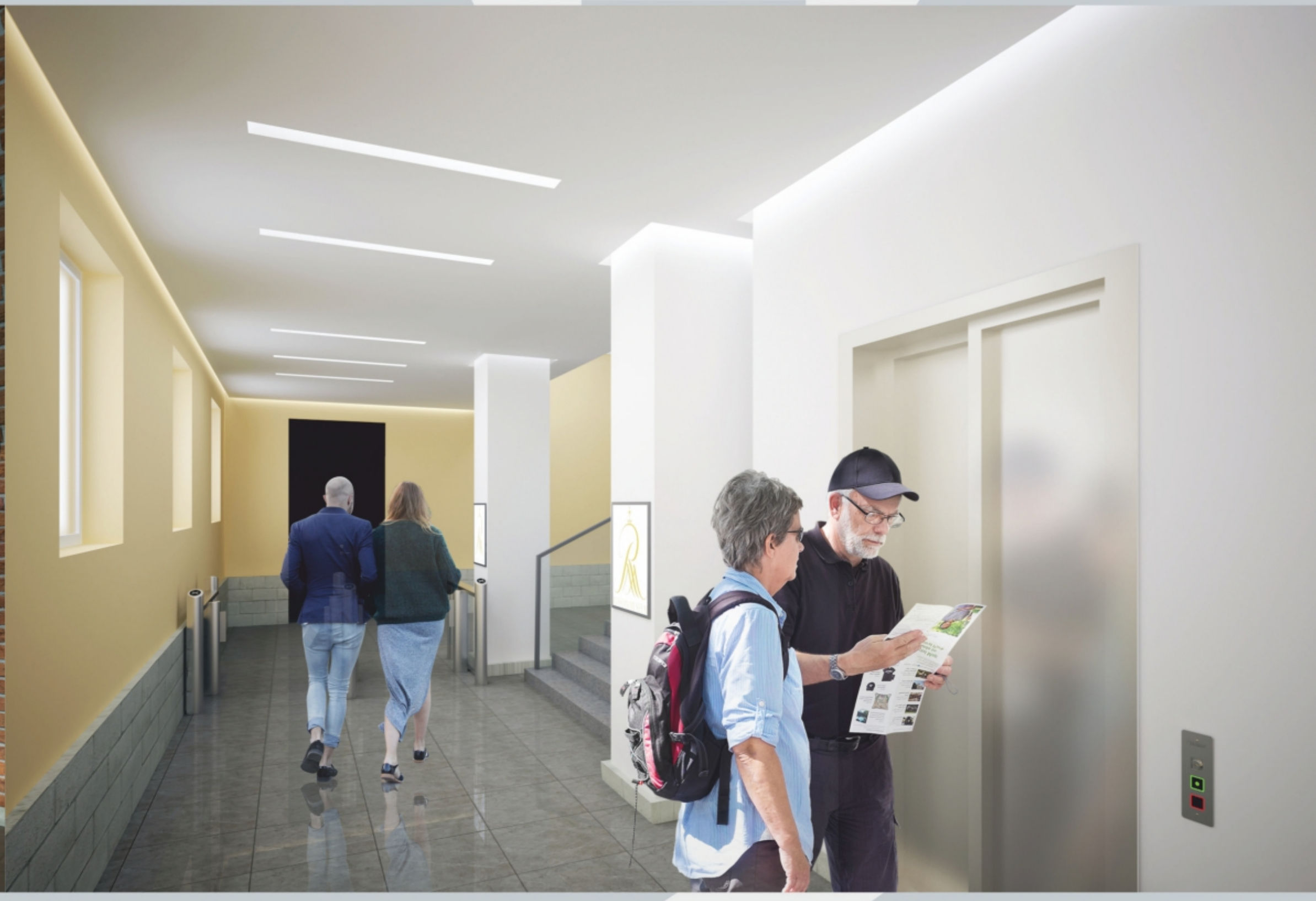
ЛИФТОВОЙ ХОЛЛ В ЦОКОЛЬНОМ ЭТАЖЕ