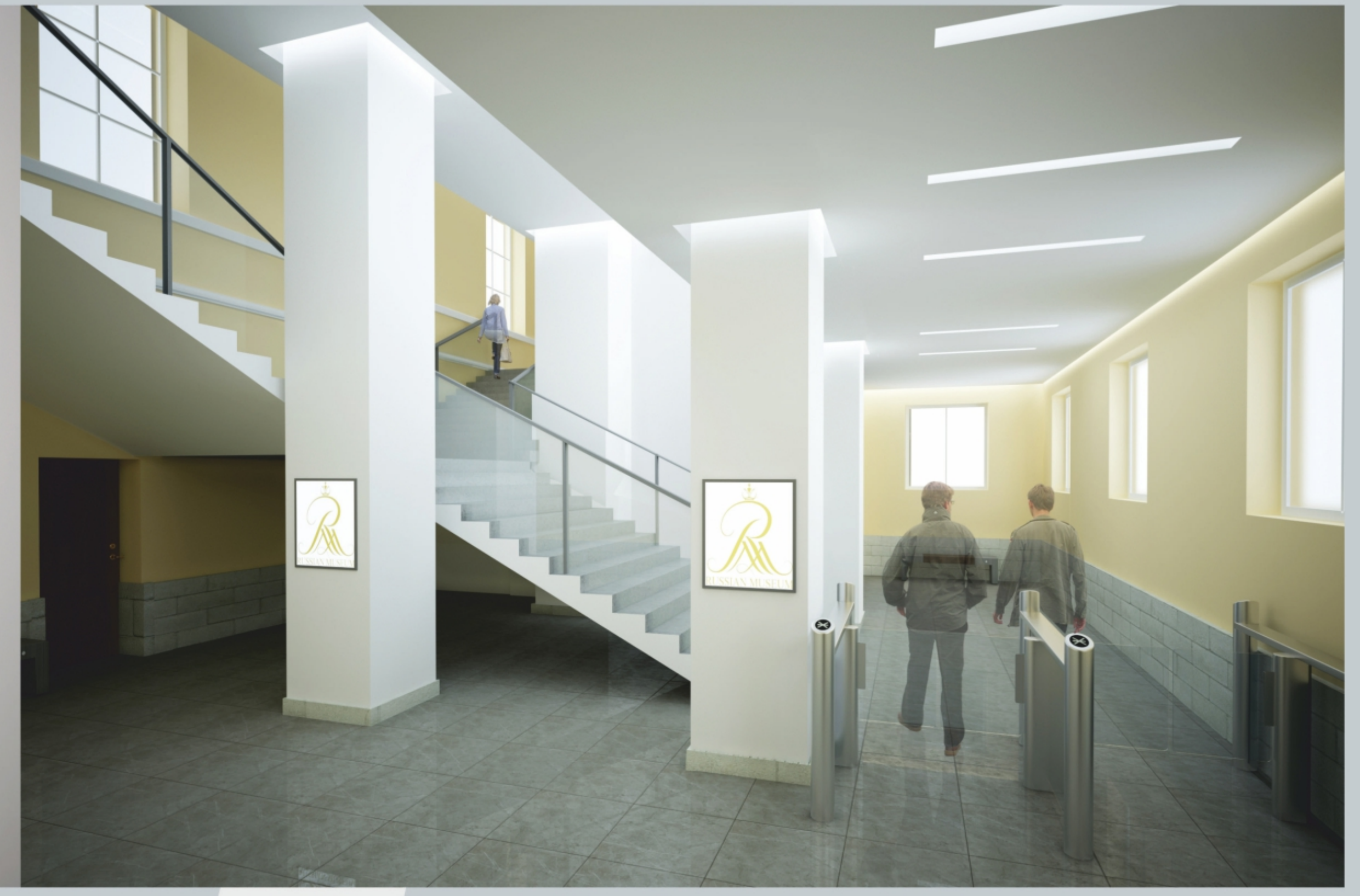
ЛИФТОВОЙ ХОЛЛ В ЦОКОЛЬНОМ ЭТАЖЕ