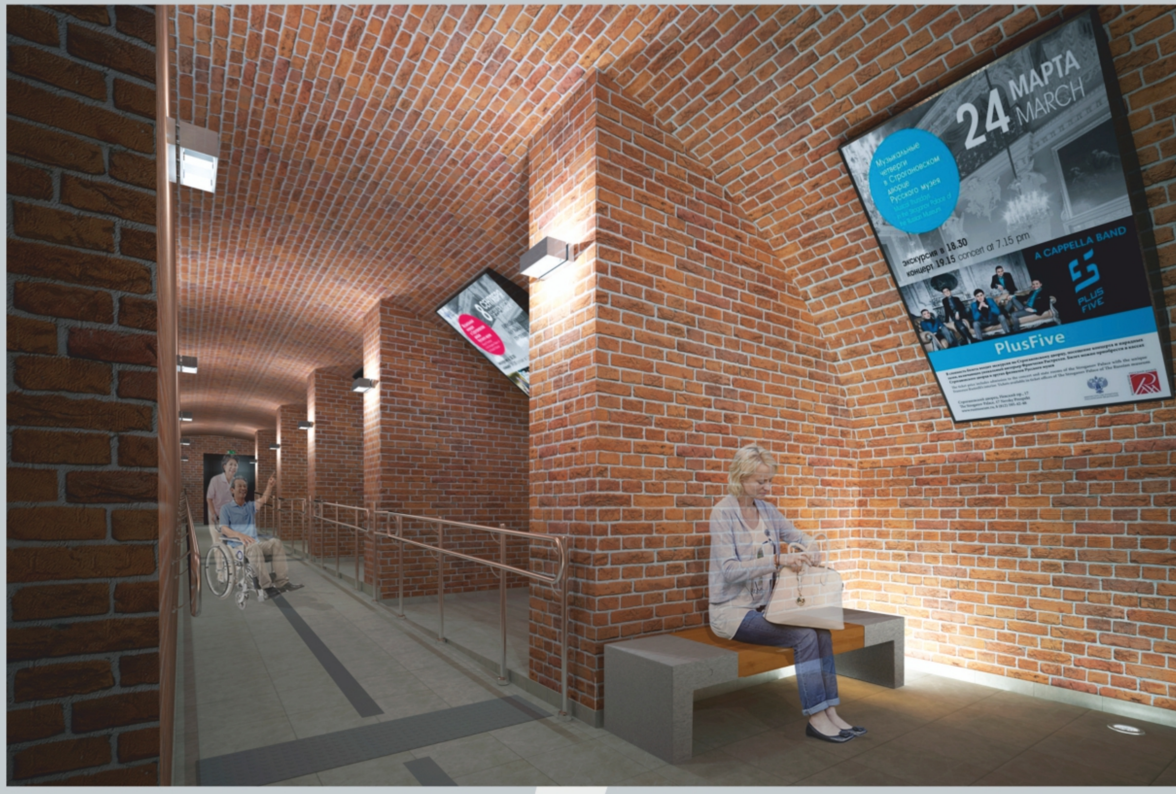
ВХОДНАЯ ГРУППА ДЛЯ МГК В ЦОКОЛЬНОМ ЭТАЖЕ